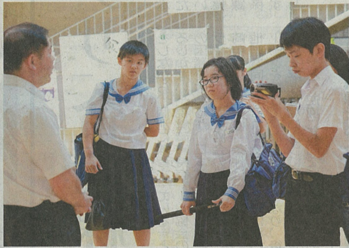
ドキュメンタリーの撮影に臨む広野中の生徒ら(昨年9月、福島県広野町で)

国際アカデミー高等部では15年度から、1年生が年70コマ(1コマ50分)で実施している。